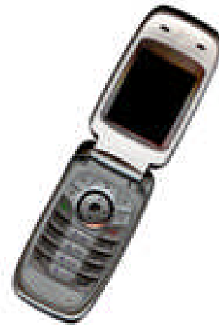
Fig. 2 Ejemplo de figura con baja resolución

Fig. 2 muestra un caso donde la resolución no es adecuada, mientras que Fig. 3 muestra una mejor adaptación de la misma figura.