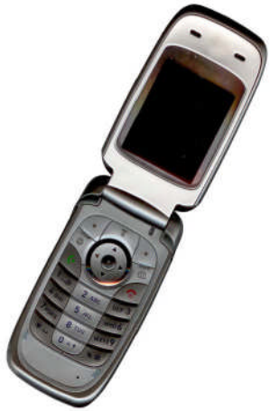
Fig. 3 Ejemplo de figura con buena resolución